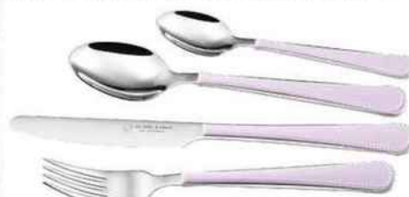
GOURMANDS Couverts, Albert de Thiers, 3,15€ pièce et 2,85€ la cuillère à café.

LES PRIX SONT DONNÉS À TITRE INDICATIF.