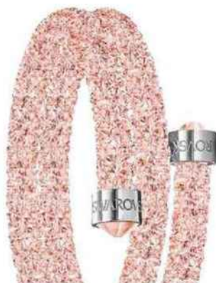
ATTACHANT Bracelet en métal et cristaux, modèle Crystaldust, Swarovski, 89€.