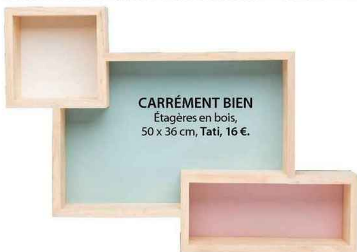
CARRÉMENT BIEN Étagères en bois, 50 x 36 cm, Tati, 16 €.