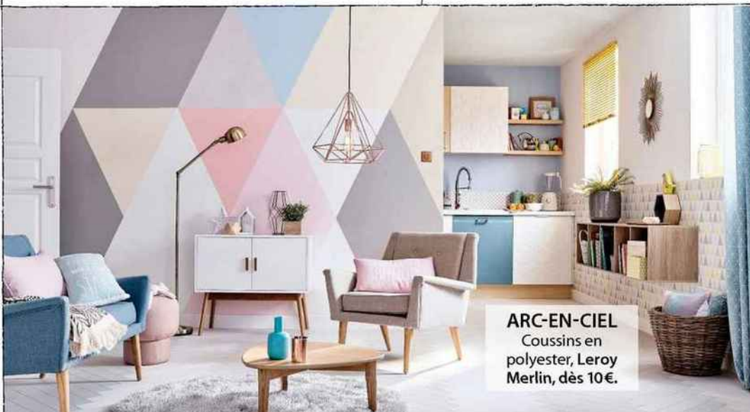
ARC-EN-CIEL Coussins en polyester, Leroy Merlin, dès 10€.