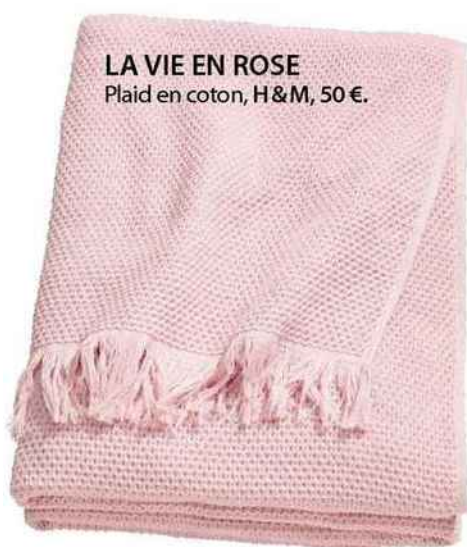
LA VIE EN ROSE Plaid en coton, H&M, 50 €.