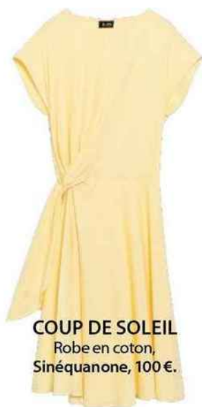
COUP DE SOLEIL Robe en coton, Sinéquanone, 100 €.