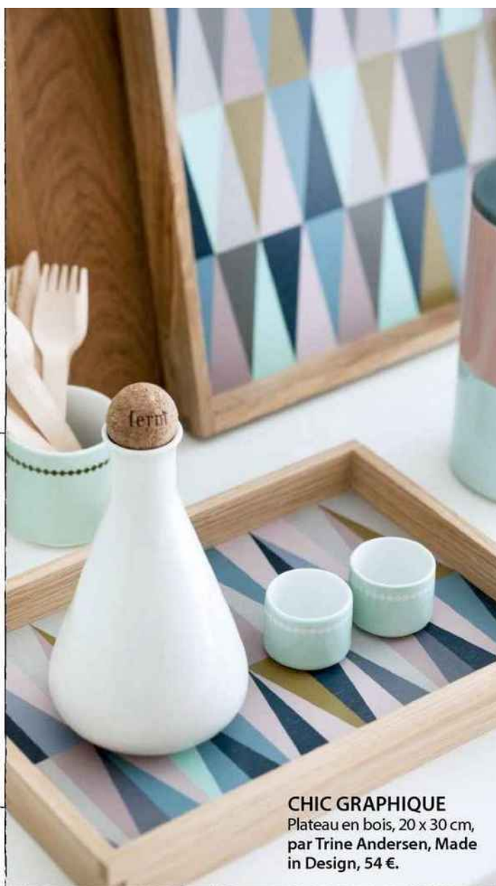
CHIC GRAPHIQUE Plateau en bois, 20 x 30 cm, par Trine Andersen, Made in Design, 54 €.

© MARCO DIARIC - ARMIN ZOGRAJIM - BY SWATCH - PEAS UNDERSTANDING. LES PRIX SONT DONNÉS À TITRE INDICATIF.