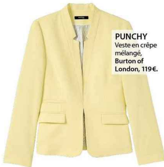
PUNCHY Veste en crêpe mêlé, Burton of London, 119€.