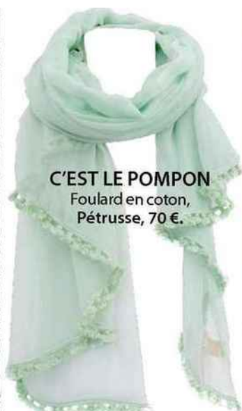
C'EST LE POMPON Foulard en coton, Pétrusse, 70 €.