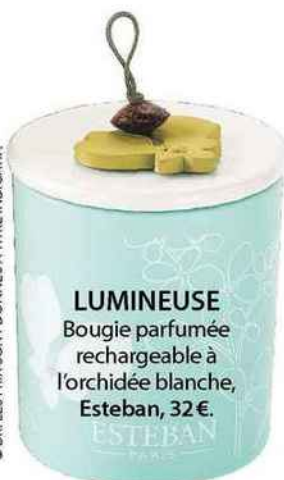
LUMINEUSE Bougie parfumée rechargeable à l'orchidée blanche, Esteban, 32€.

LES PRIX SONT DONNÉS À TITRE INDICATIF.