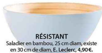
RÉSISTANT Saladier en bambou, 25 cm diam, existe en 30 cm de diam, E. Leclerc, 4,90€.