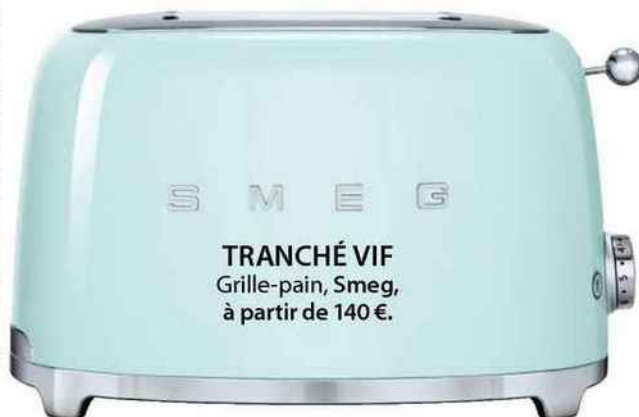
TRANCHÉ VIF Grille-pain, Smeg, à partir de 140 €.

© MARCO DIARIC - ARMIN ZOGRAJIM - BY SWATCH - PEAS UNDERSTANDING. LES PRIX SONT DONNÉS À TITRE INDICATIF.