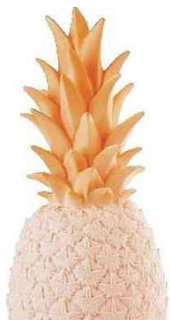
EXOTIQUE Veilleuse en vinyle moulé, LED, H 37 cm, Goodnight Light chez Lightonline, 89€.