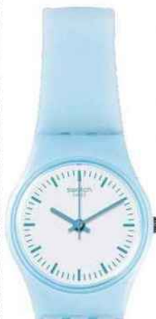
À LA BONNE HEURE! Montre en plastique, Swatch, 45 €.