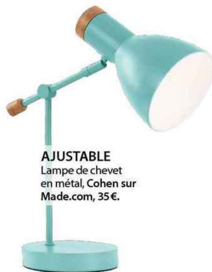
AJUSTABLE Lampe de chevet en métal, Cohen sur Made.com, 35€.